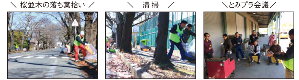
桜並木の落ち葉拾い

来春に向けて夜の森の桜並木の清掃活動を行い、10月に収穫したサツマイモを焼き芋にして秋の味覚を味わいながら、とみプラ会議を開催しました。10名程での話し合いでしたが、来年度のサポーター活動には、来春に再開を迎える「学校」というキーワードが不可欠であることを共有しました。