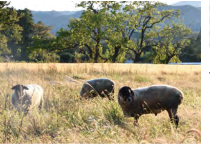
「とみ」「そら」「ひかり」と名前が決まりました!

松明作りのワークショップでブース出展しました。「麓山の火祭り」をイメージする松明の存在感は、来場者の目を引きました。ミニ松明のキャンドルづくりは大人気で、子供たちから大人の方まで、ふるさとの祭りの歴史を感じながら楽しく参加していただきました。