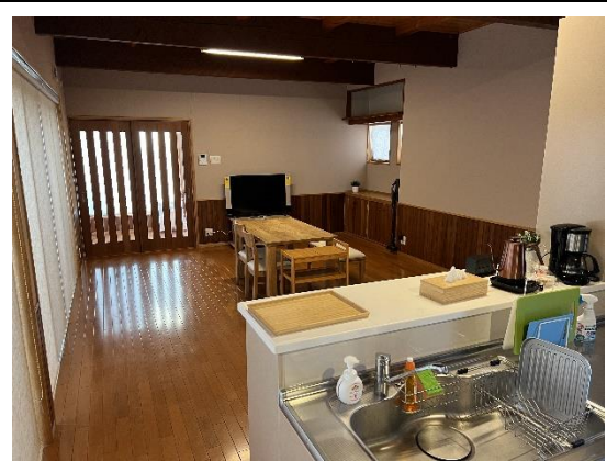
1階 リビング・キッチン